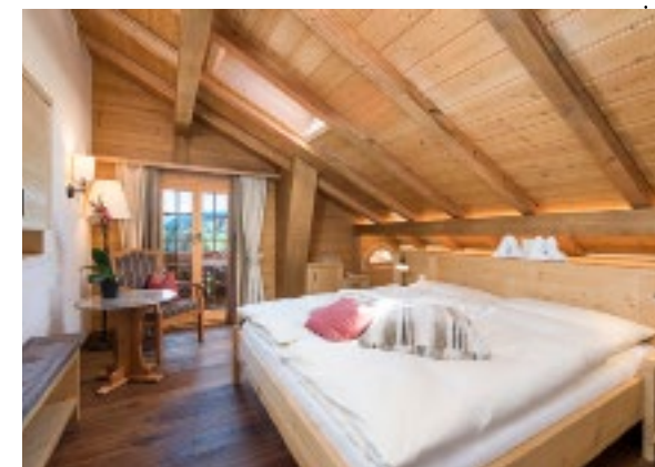
Zum Wohlfühlen: die liebevoll eingerichteten Zimmer. Feeling of well-being: the lovingly furnished rooms.